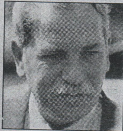
מר חיים. חופשה ללא תשלום

מר חיים: קיבלתי את ההחלטה מיוזמתי למרות שבידי חוות רעת מעו"ד שאין מניעה בהמשך תפקודי