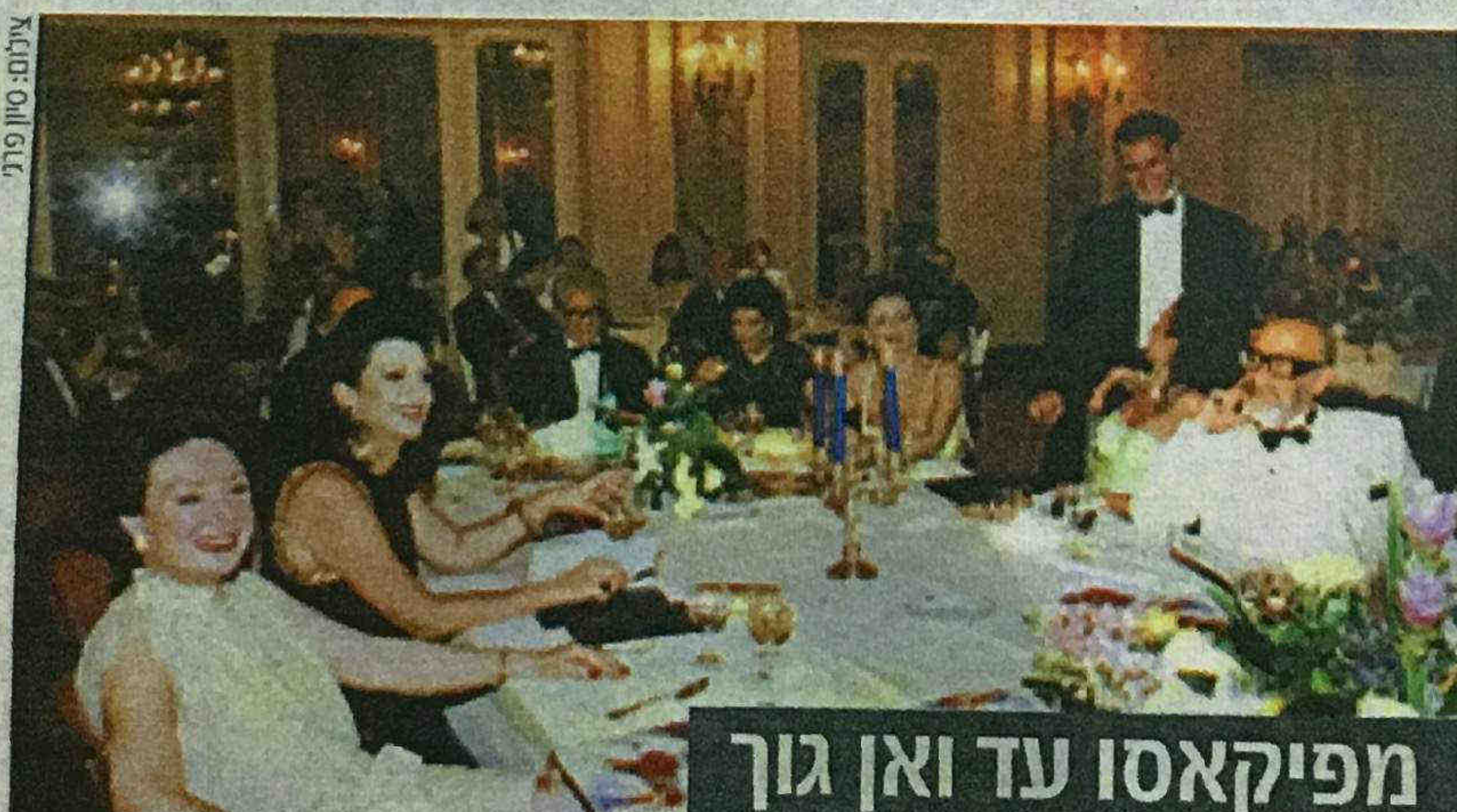
מפיקאסו עד ואן גוך