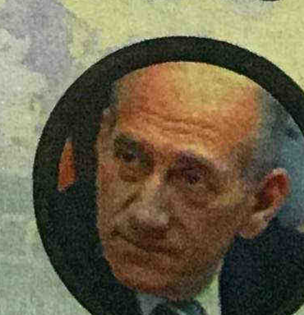
אהוד אולמרט. מקורב