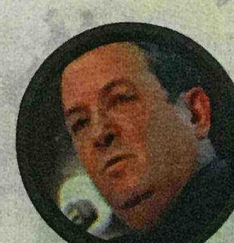
אהוד ברק. שכן