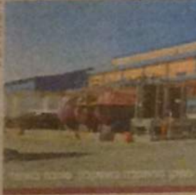
תשתיות חן המפרון למשבר

amr.nag@cabalnet.co.il golan.hadani@cabalnet.co.il