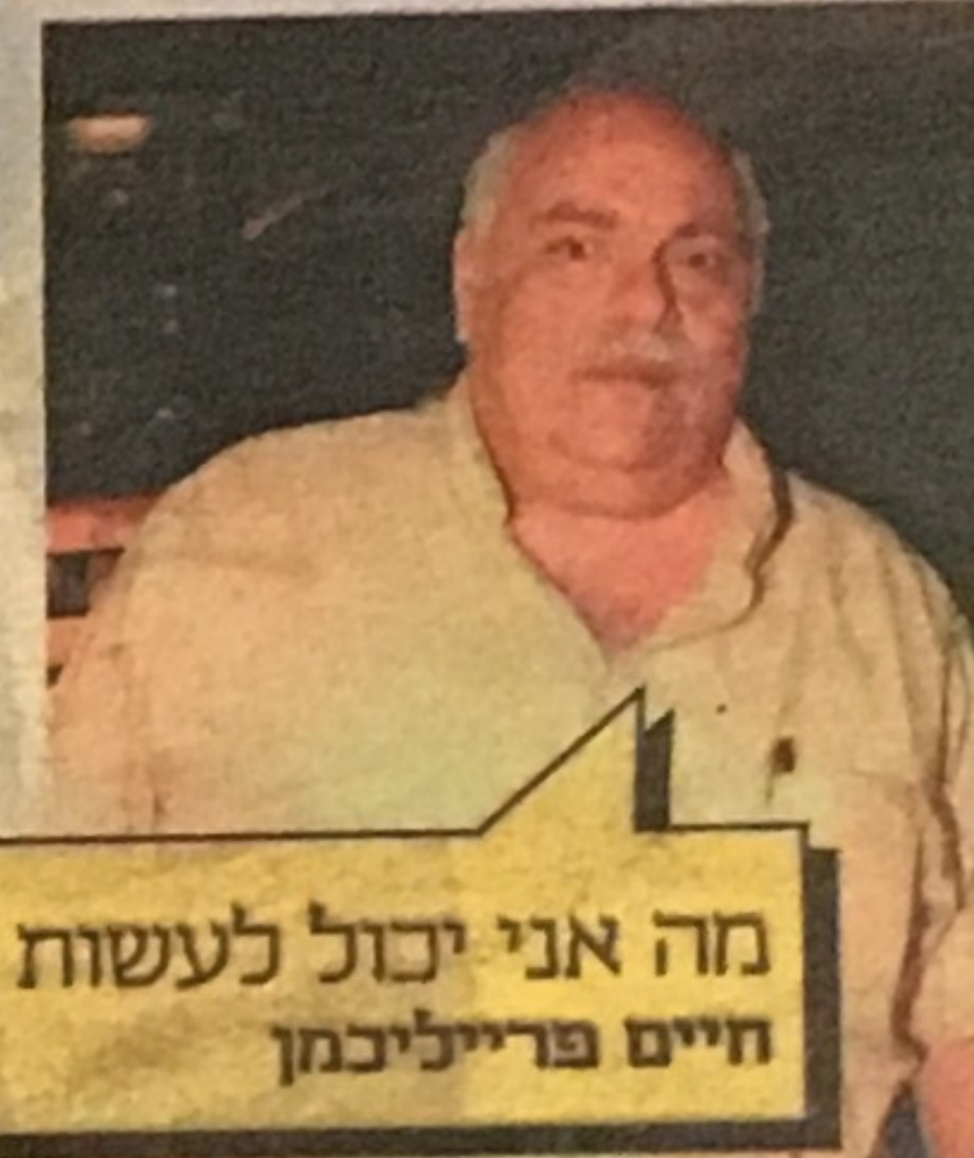
מה אני יכול לעשות חיים פרייליכמן