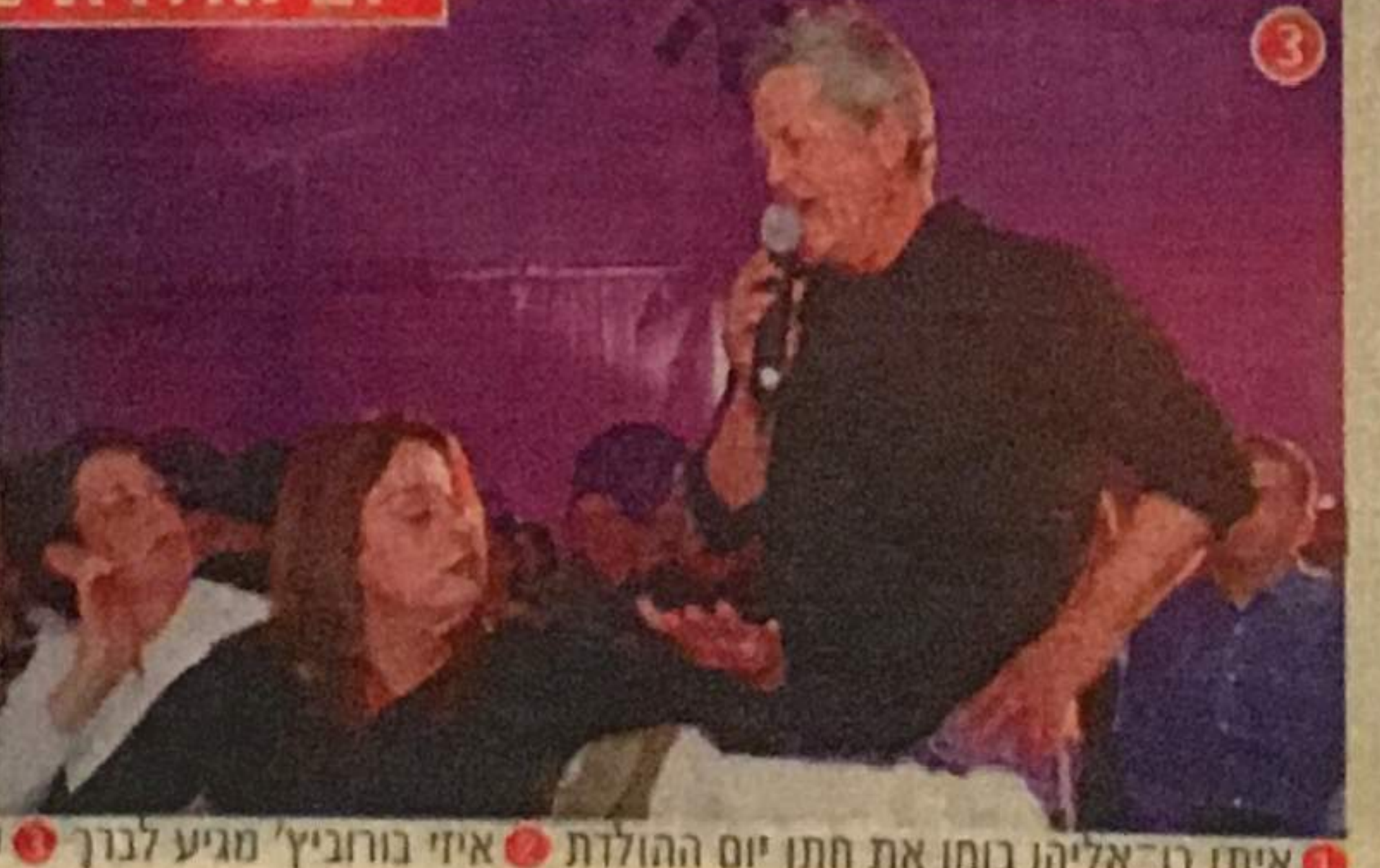
1. איתן בן-אליהו בוחן את חתן יום ההולדת 2. איזי בורנביץ' מגיע לבנך 3. שלמה ארצי שר לרונה רמון 4. שמעון פרס ואוריאל רייכמן צוחקים עם ארצי