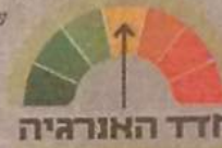
מדד האנרגיה של כלכליסט והמכון הישראלי לאנרגיה וסביבה