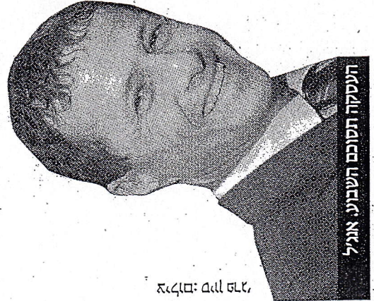
העסקה הסוכם השבועי אנג'ל